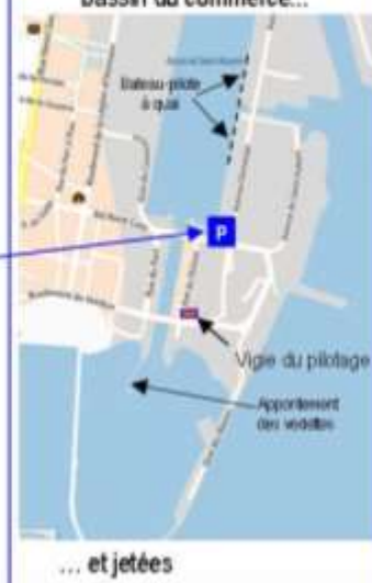
SAINT-NAZAIRE bassin du commerce...

Si vous êtes intéressé(e-s) par cette visite, veuillez bien vous inscrire à l'aide du coupon-réponse ci-dessous. Le nombre de places est limité à 24. Un covoiturage sera défini entre les participants en temps utile.