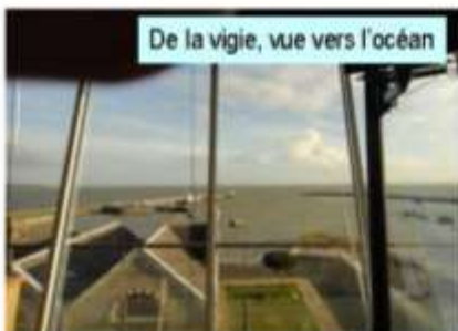
De la vigie, vue vers l'océan