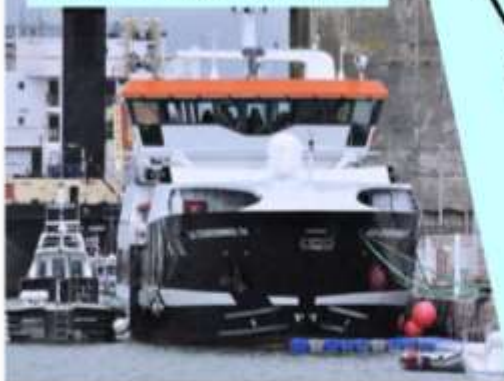
La COURONNE IV amarrée dans le bassin du Commerce à St-Nazaire