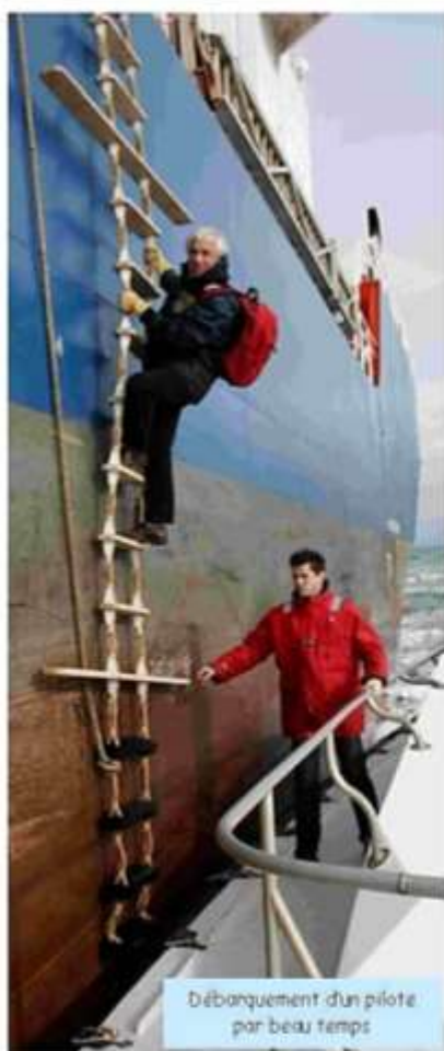
Débarquement d'un pilote par beau temps