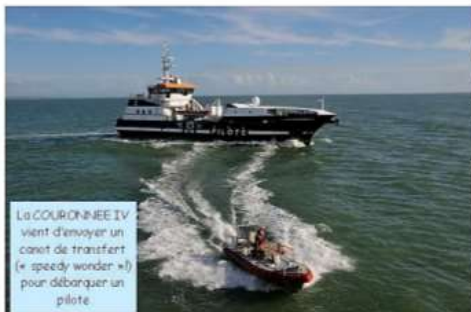
La COURONNE IV vient d'envoyer un canot de transfert (« speedy wonder ») pour débarquer un pilote